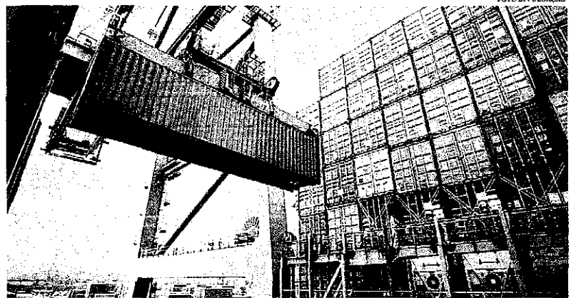
Nos cálculos da Abinec, no médio prazo o acordo pode levar a um aumento de 25% a 30% das exportações do setor eletroeletrônico para a UE

O governo brasileiro identificou potencial para ampliar mercado em diversos segmentos da indústria, desde aviação até siderurgia